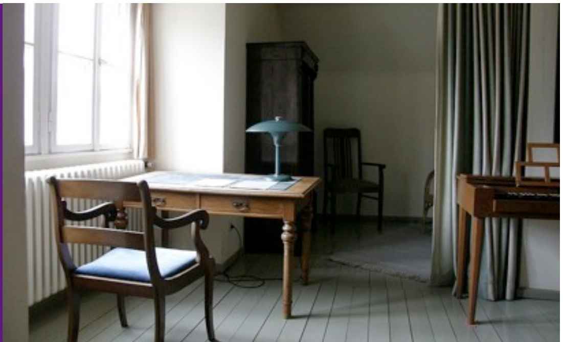
Estudio de Bonhoeffer

pastorado de la iglesia evangélica luterana de San Pablo, en la colonia alemana de la capital inglesa. En 1935 regresó a Alemania para asumir la dirección del seminario de la denominada "Iglesia Confesante". De esta época son dos obras suyas muy importantes: "El precio de la gracia" y "Vida en comunidad". Entretanto, Adolf Hitler había conseguido que el Partido Nacional-Socialista Alemán aglutinara a su alrededor los descontentos resultantes de la crisis económica de 1929. Hitler mantuvo estrechas relaciones con los sindicatos patronales que buscaban fuerzas de choque para emplearlas contra los movimientos obreros de izquierda. Logró atraerse a las clases medias, a los trabajadores en paro y a los