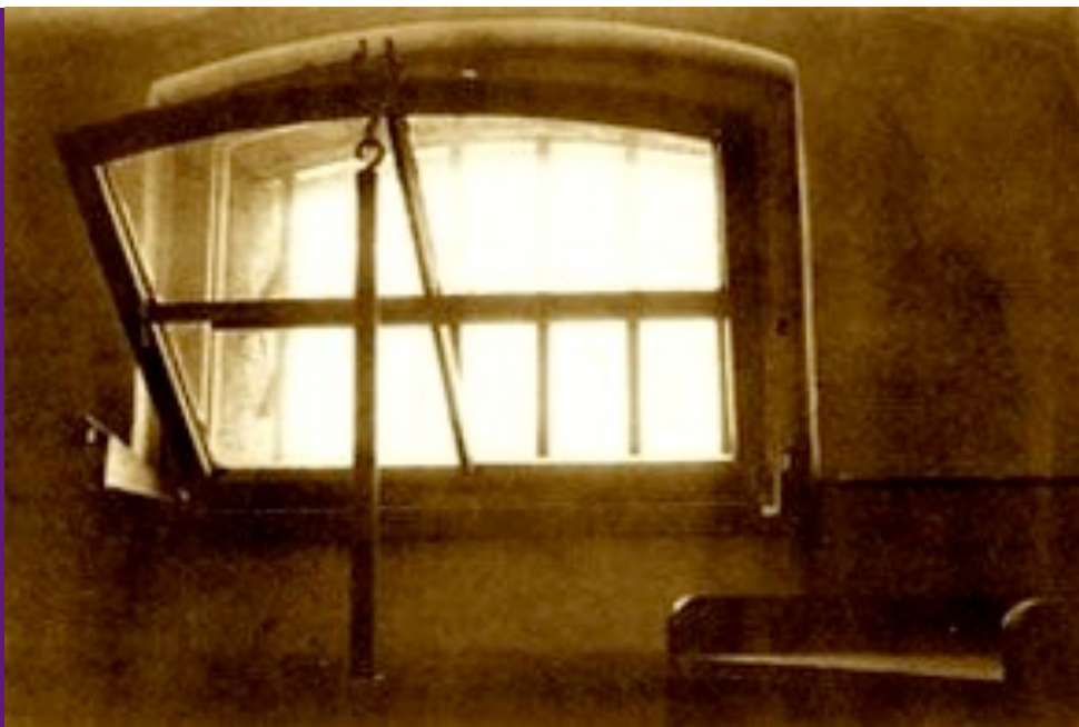
Celda de Bonhoeffer en la prisión de Tegel

Encuentro, centralidad, disponibilidad, compromiso, audacia, alegría. Aún podríamos añadir algunos criterios más pero baste por el momento con estos. El propio Bonhoeffer los encarnó como pocos, hasta sus últimas consecuencias. Ahí queda su ejemplo, que puede reclamar para sí las mismas palabras que Pablo de Tarso remitió a sus hermanos de Corinto: “Sed imitadores de mí así como también yo lo soy de Jesucristo”. Sola Gratia, por supuesto.