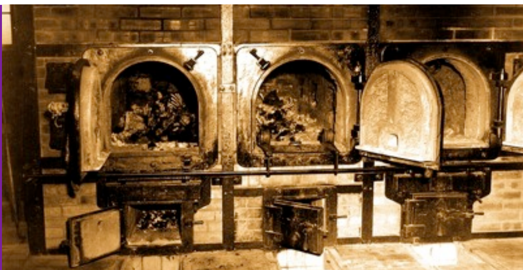
Crematorio con restos humanos en un campo de concentración nazi.

Esto significa que la corporeidad histórica de la Iglesia ha de implicar que en ella “tome cuerpo” la realidad y la acción de Jesucristo porque su presencia en la historia depende de lo que sea y viva su Iglesia. Jesucristo acepta ser mediado por ella y ella (la Iglesia) confiesa la responsabilidad de hacerle presente en la historia. Aquí aparece una de las grandes intuiciones teológicas de Bonhoeffer para las siguientes generaciones cristianas: La Iglesia, más de una realidad esencial e invisible, es una construcción social que ha de visibilizarse en el mundo (“Una ciudad asentada sobre un monte no se puede esconder” (Mt. 5:14) y lo es porque, por su propia naturaleza, se define como la manifestación de la vida del Jesús resucitado en forma de comunidad por la acción del Espíritu.