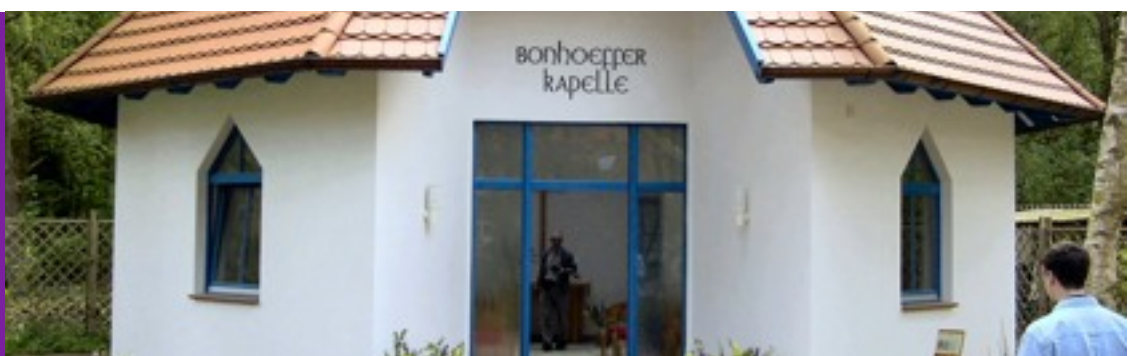
Capilla de Bonhoeffer en Alemania

Uno de los objetivos de Bonhoeffer a partir de este momento será desenterrar a Jesús de Nazaret de los despachos de los teólogos y proclamarlo a la Iglesia y al mundo, libre de dogmatismos y adherencias, de interpretaciones interesadas e ideologías inconfesadas que históricamente lo han desfigurado convirtiéndole en una imagen irreconocible.