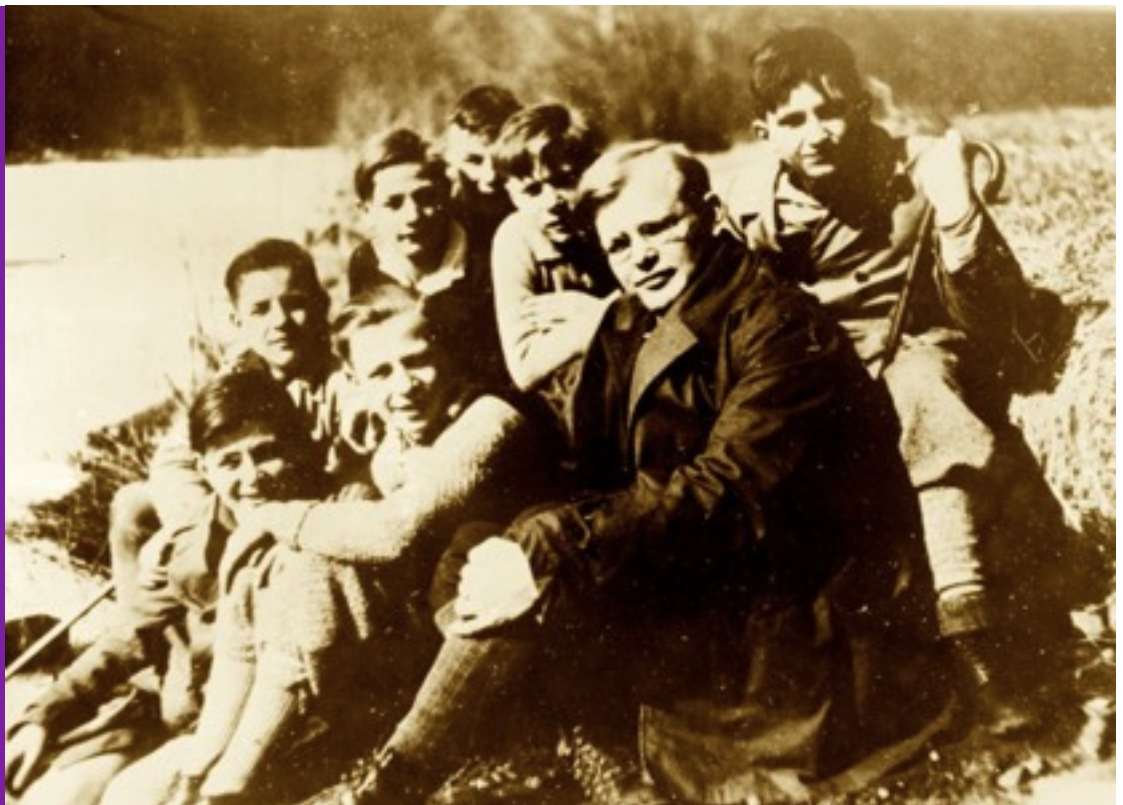
Bonhoeffer con sus alumnos en 1932.

El centro y eje de la espiritualidad cristiana es Jesús, no nuestra propia autorrealización y perfección espiritual