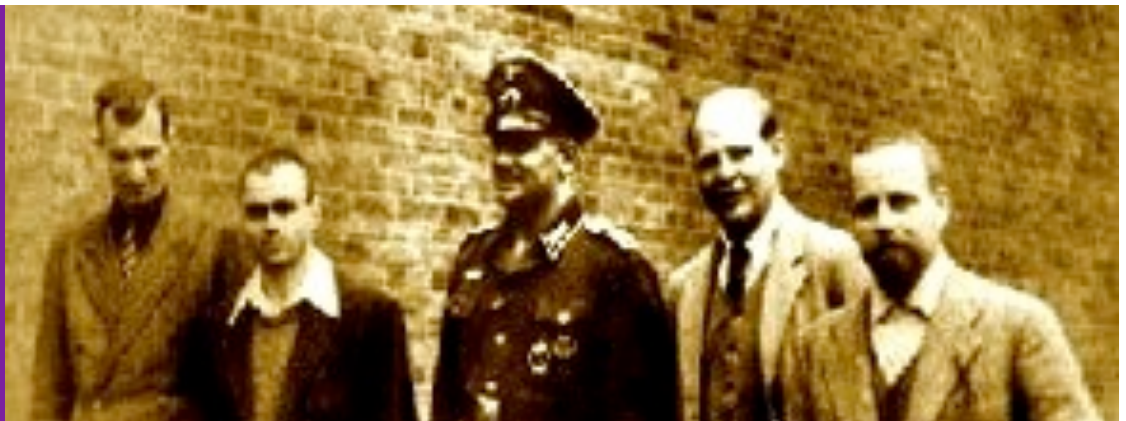
Bonhoeffer en prisión preventiva en Tegel

Audacia y valor. Se trata de la audacia que vence al miedo, el gran obstáculo para el seguimiento, el gran incapacitador, el gran enemigo de la fe. Nada adormece más al discípulo